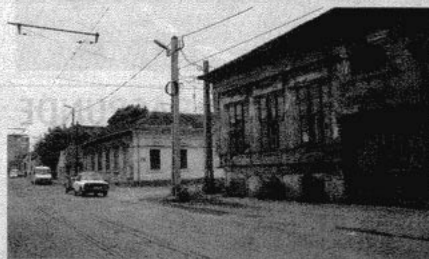
Clădirea Preparandia va fi restaurată și va deveni muzeu

Valoarea totală a proiectului este de 58.782.037 lei dintre care 44.737.544,88 lei reprezintă finanțarea din fonduri structurale nerambursabile.